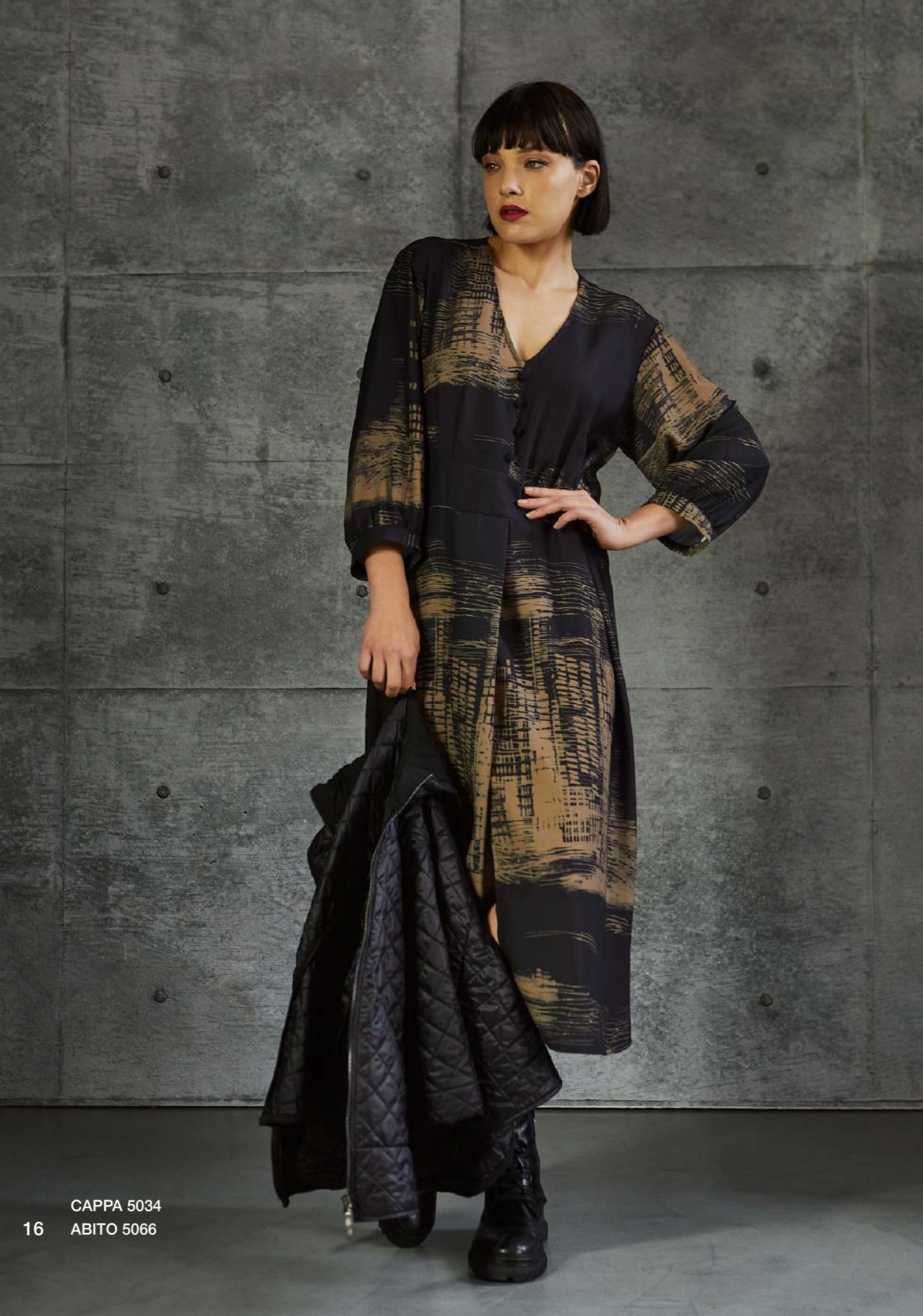
CAPPA 5034 ABITO 5066