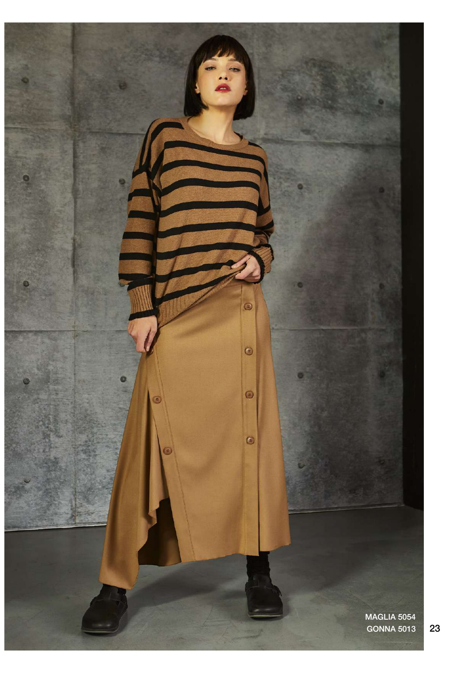
MAGLIA 5054 GONNA 5013