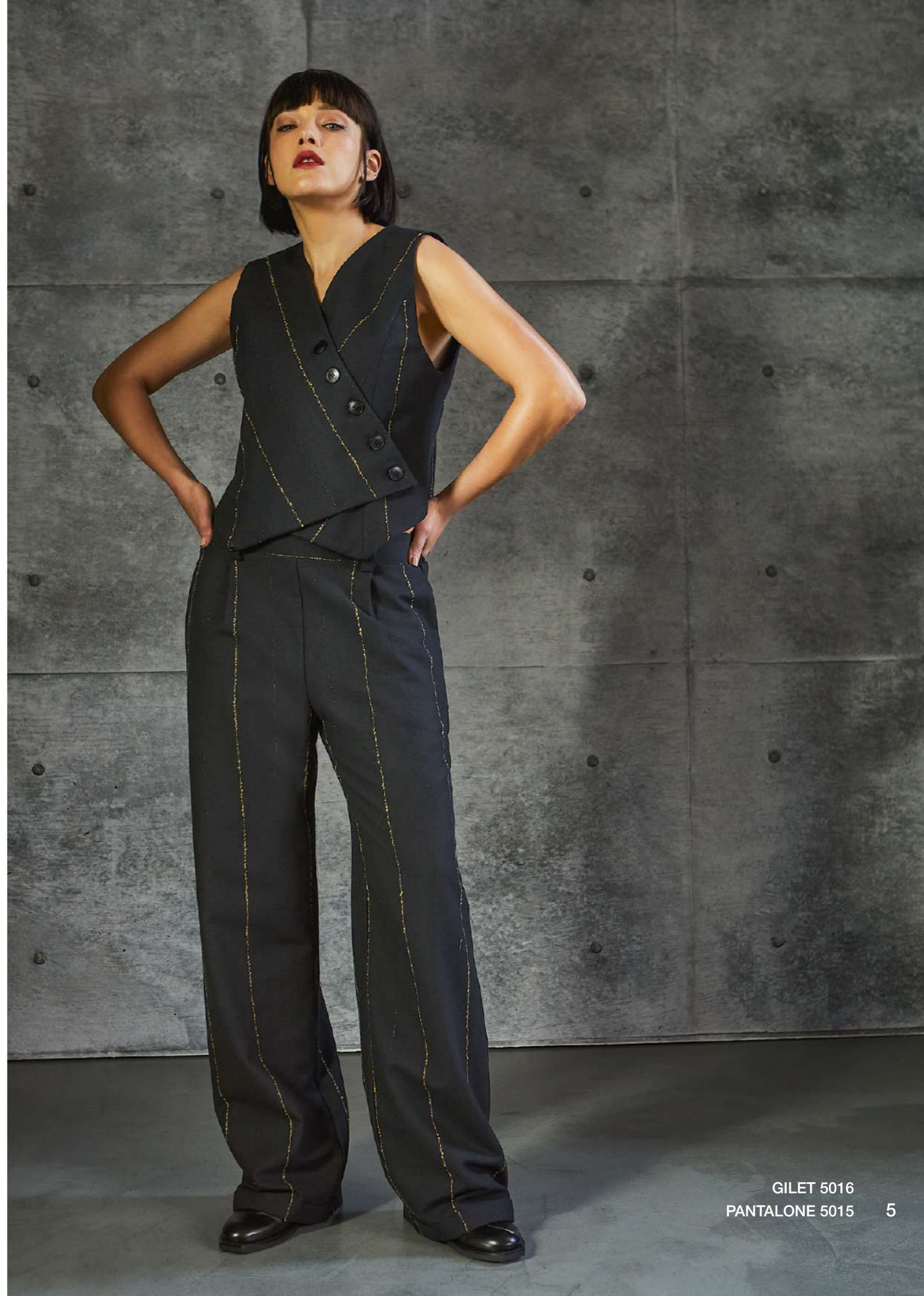
GILET 5016 PANTALONE 5015 5