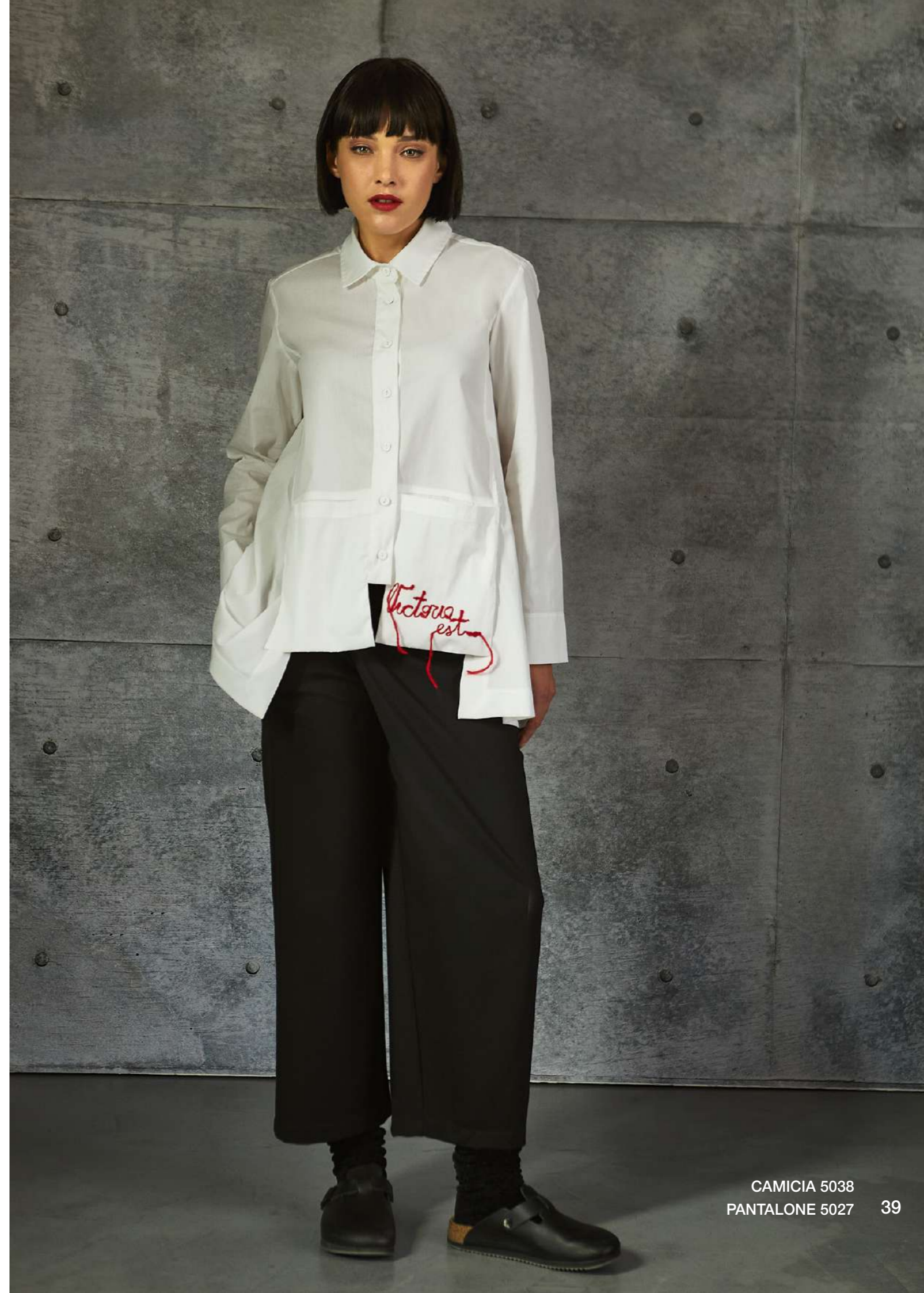
CAMICIA 5038 PANTALONE 5027 39