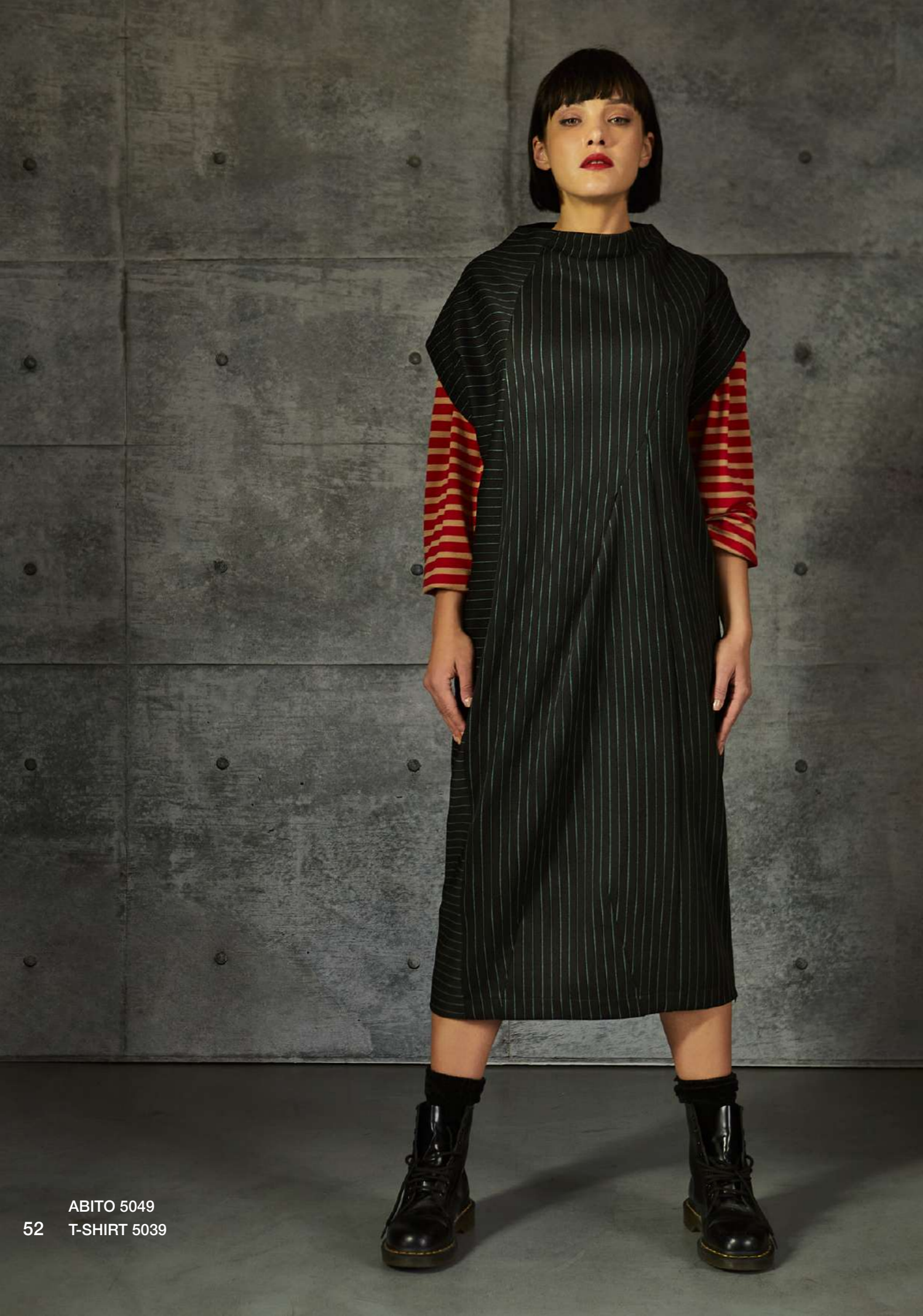
ABITO 5049 T-SHIRT 5039