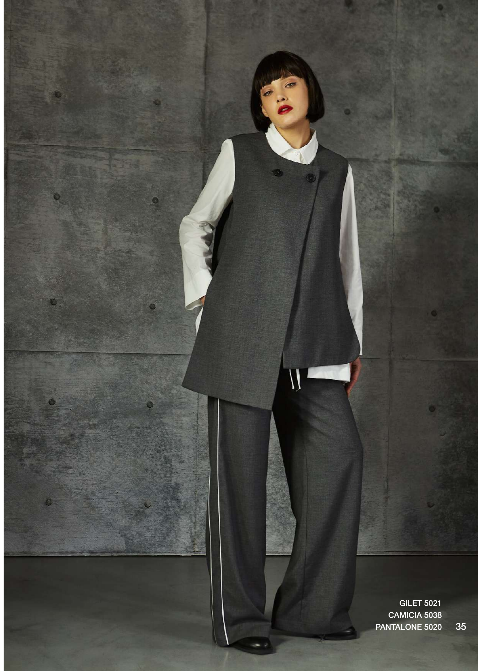
GILET 5021 CAMICIA 5038 PANTALONE 5020