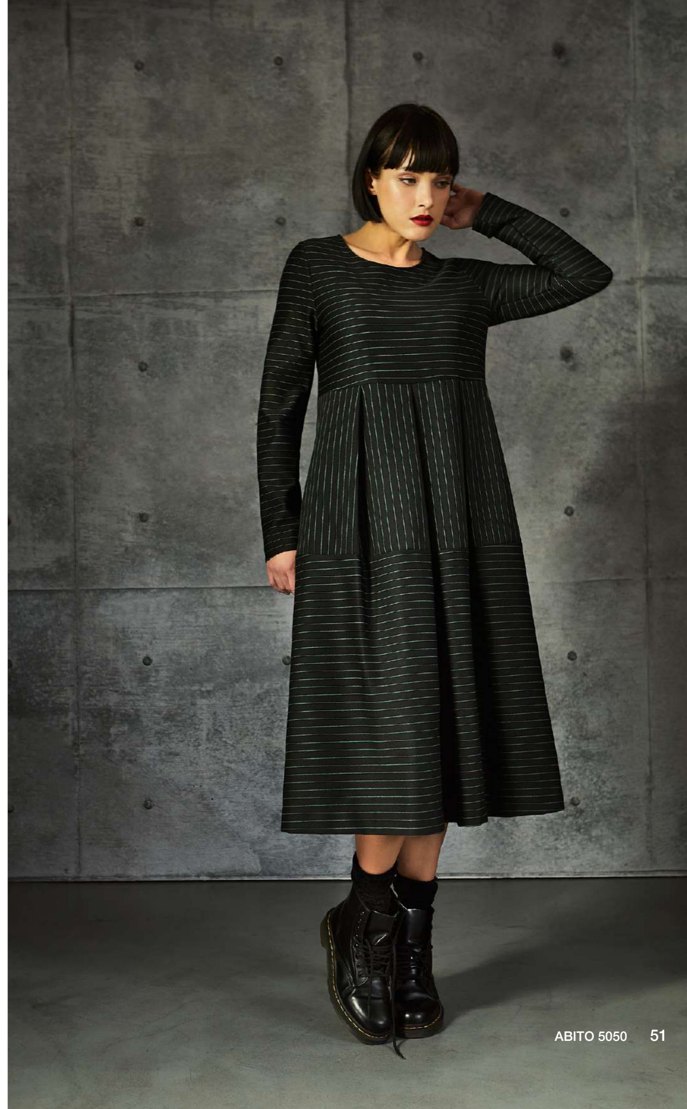
ABITO 5050 51