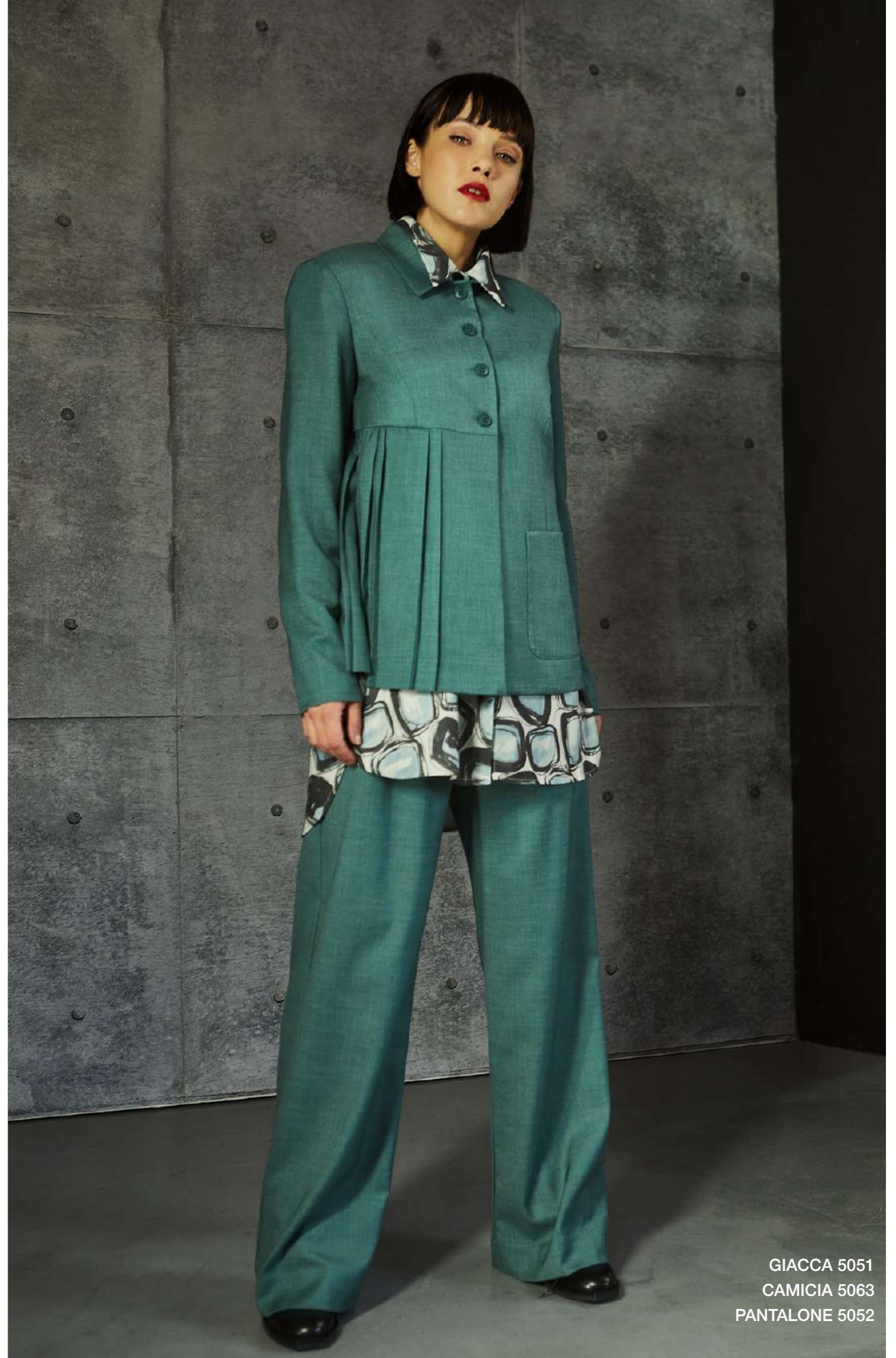
GIACCA 5051 CAMICIA 5063 PANTALONE 5052