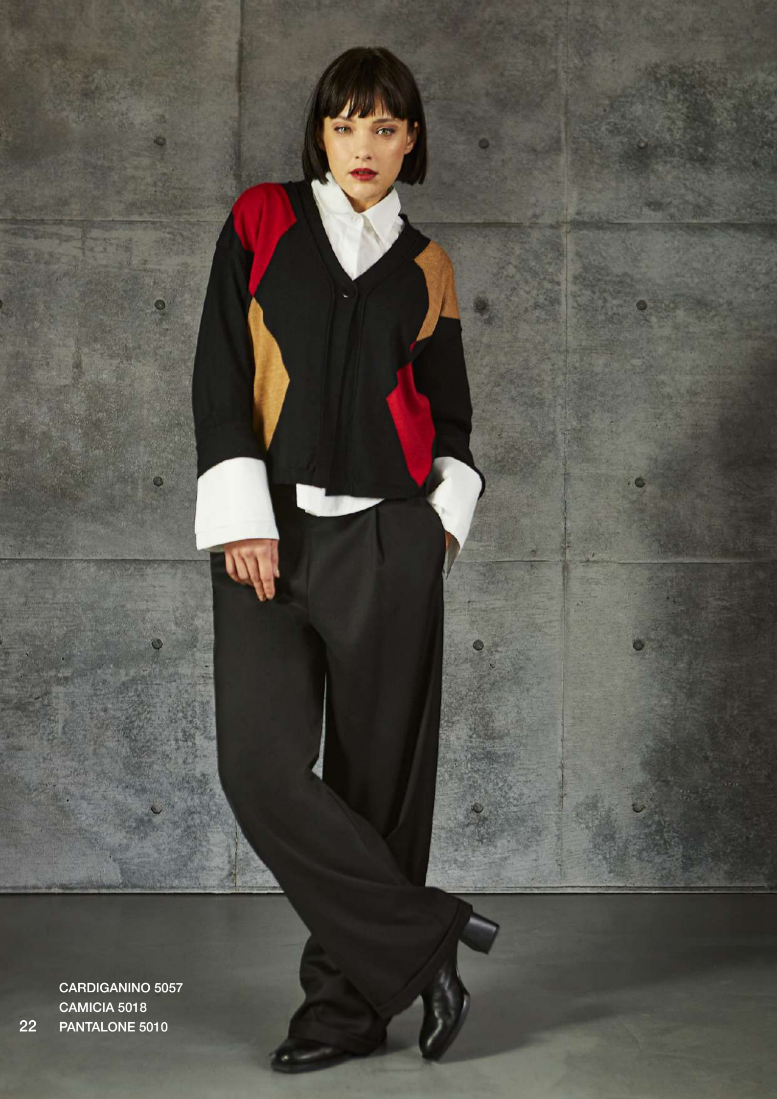
CARDIGANINO 5057 CAMICIA 5018 PANTALONE 5010