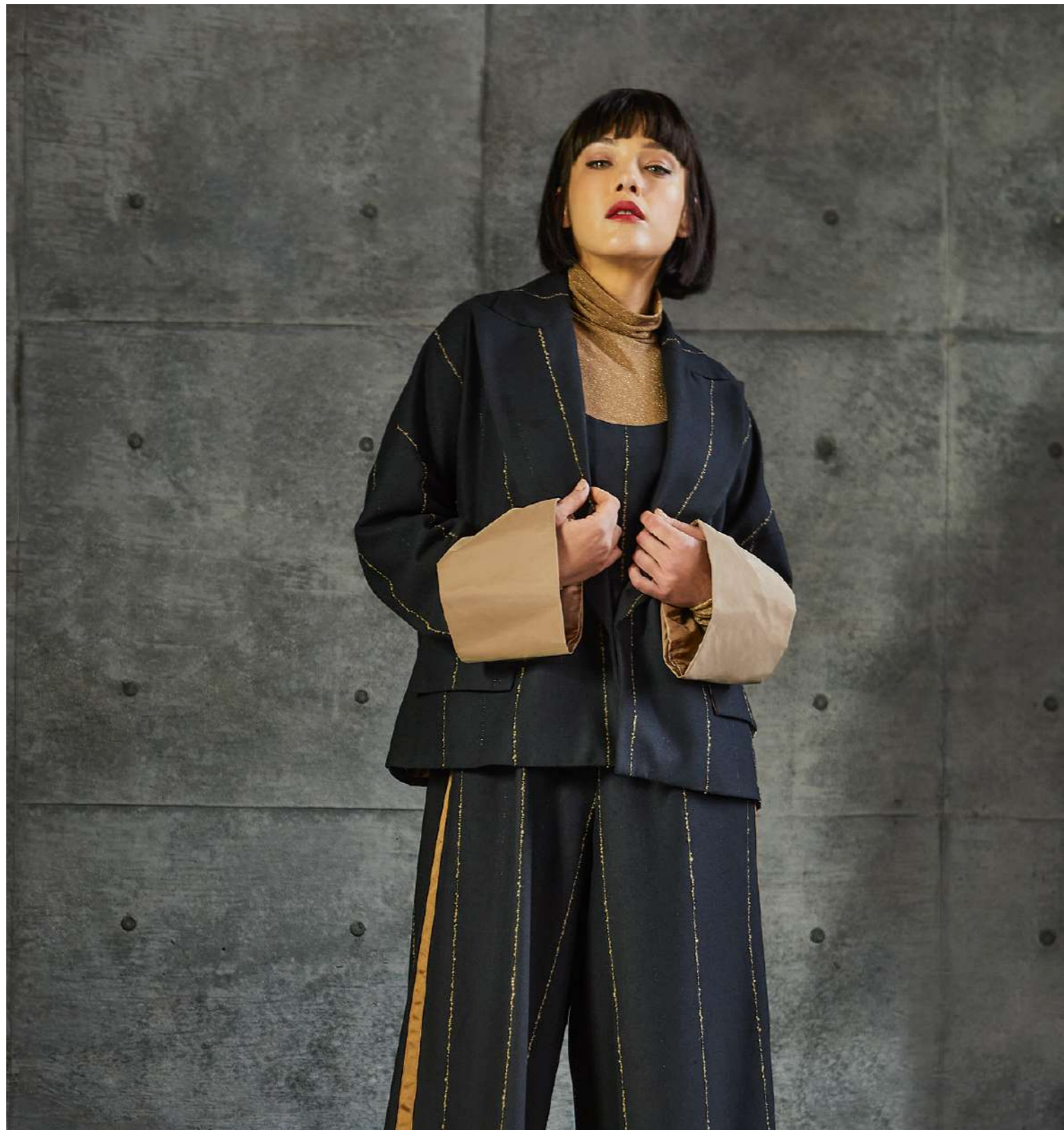
GIACCA 5014 LUPETTO 5008 TUTA 5017