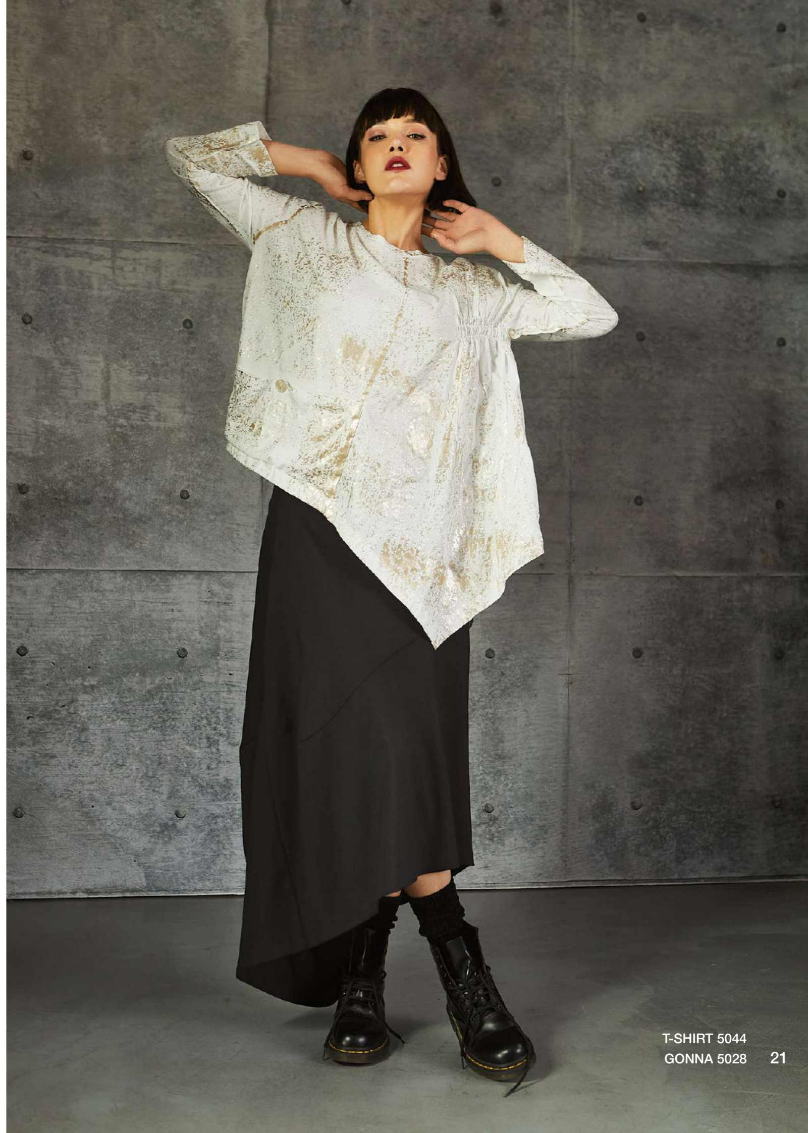
T-SHIRT 5044 GONNA 5028