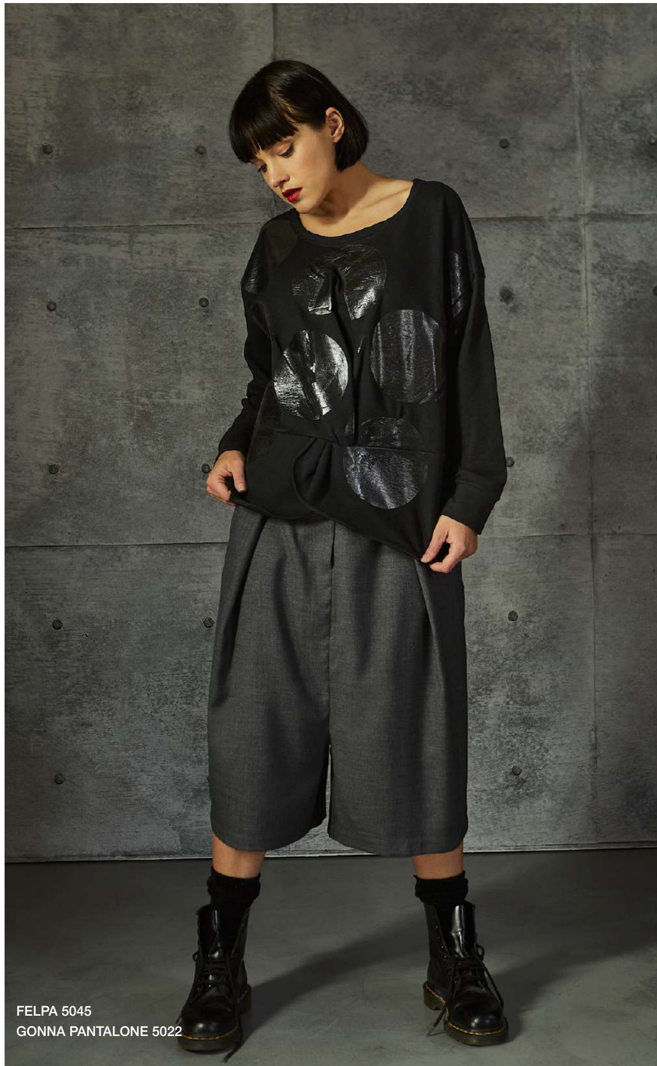
FELPA 5045 GONNA PANTALONE 5022