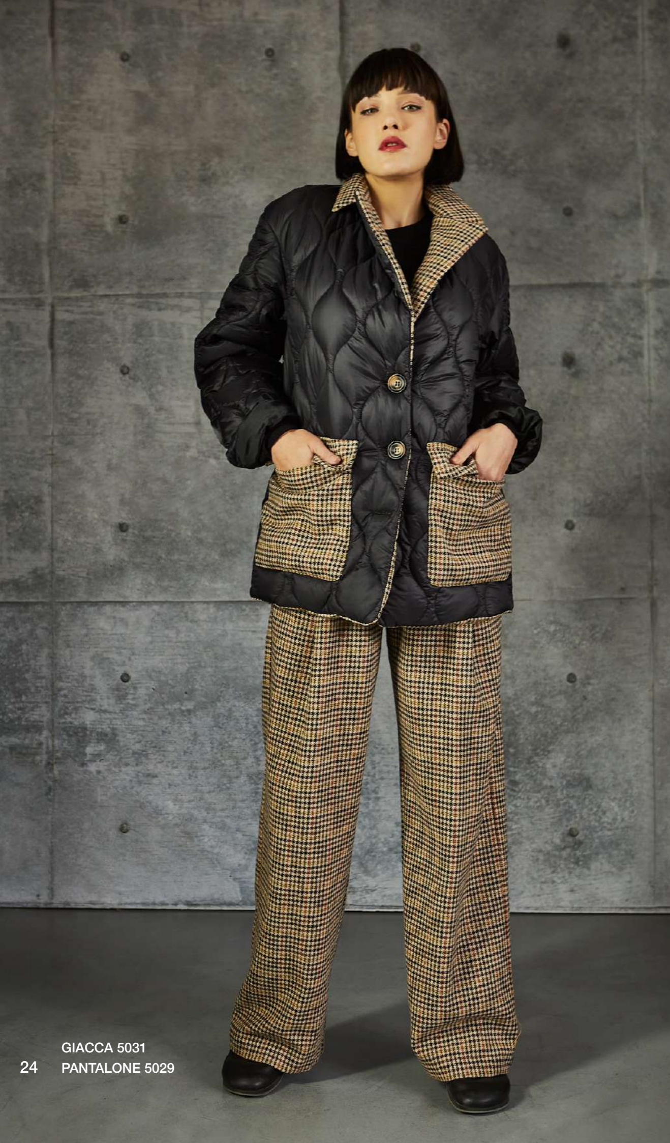
GIACCA 5031 PANTALONE 5029