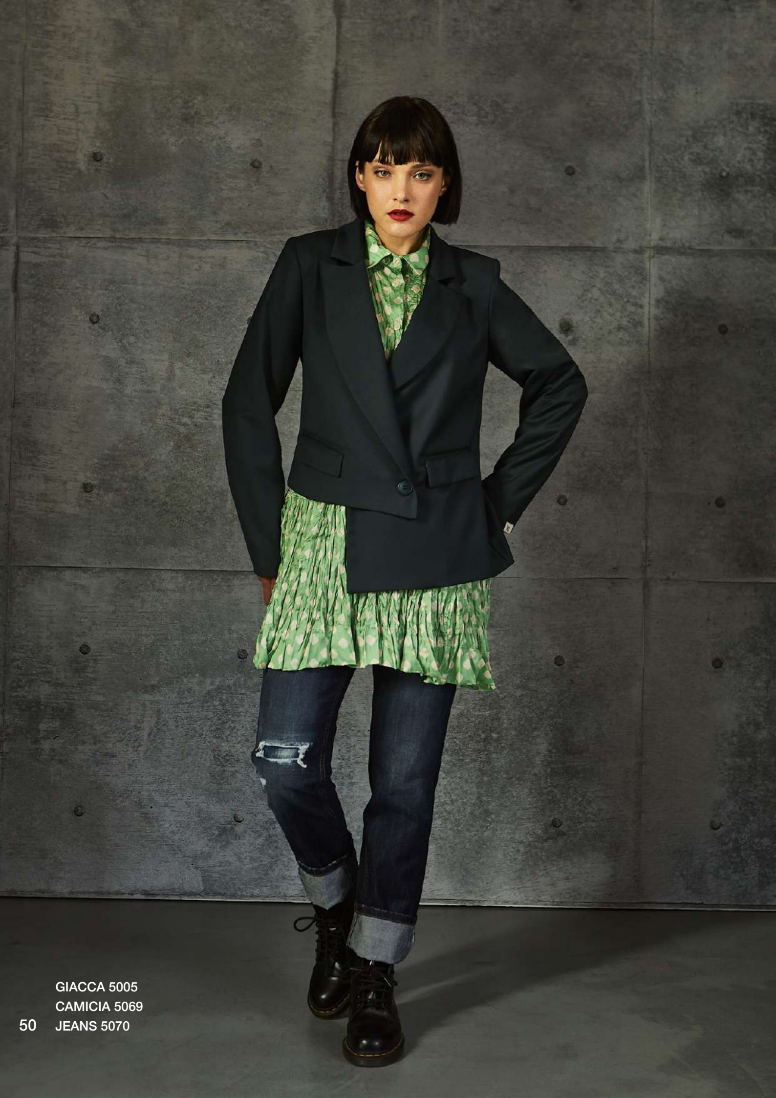
GIACCA 5005 CAMICIA 5069 JEANS 5070