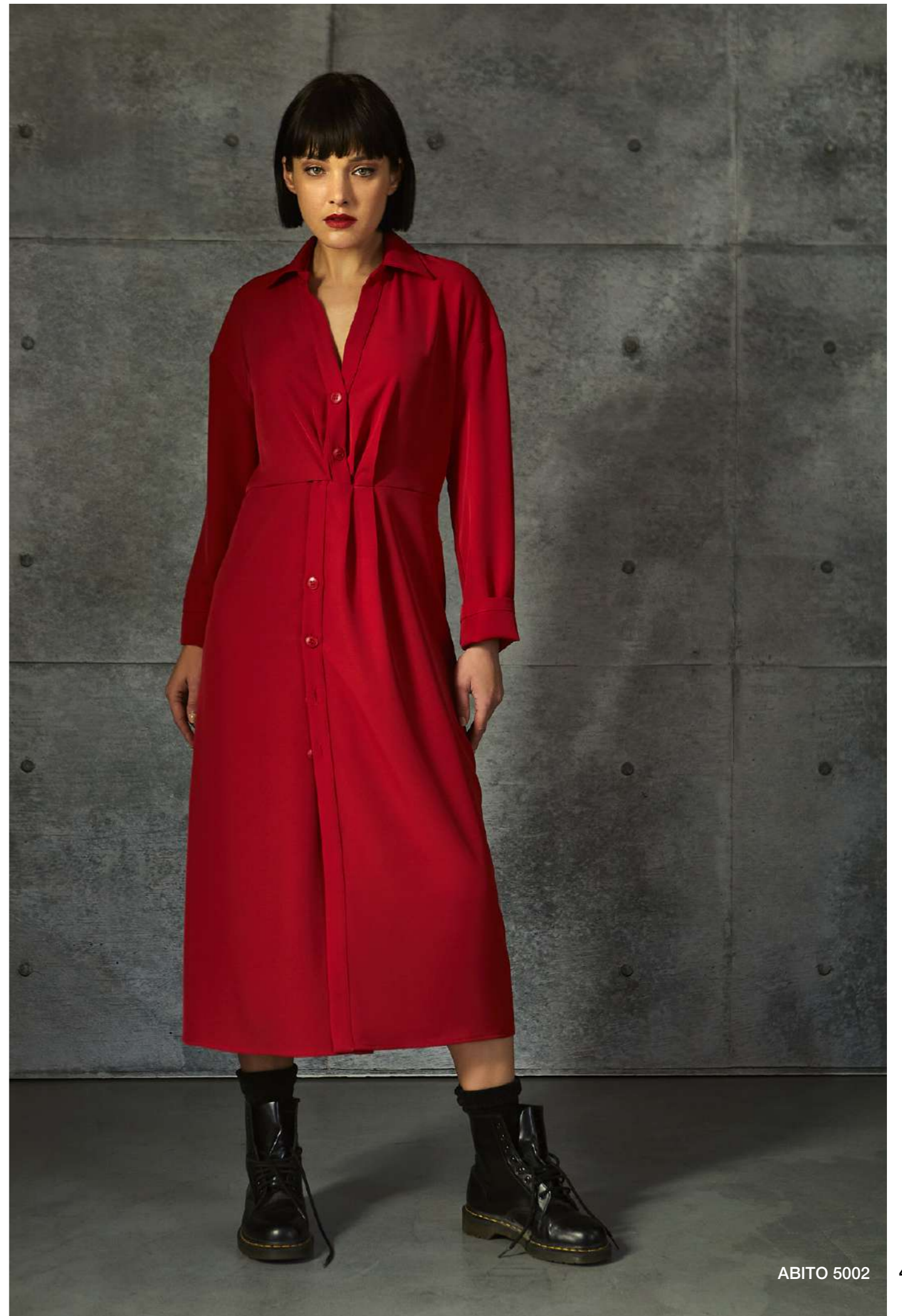
ABITO 5002 45