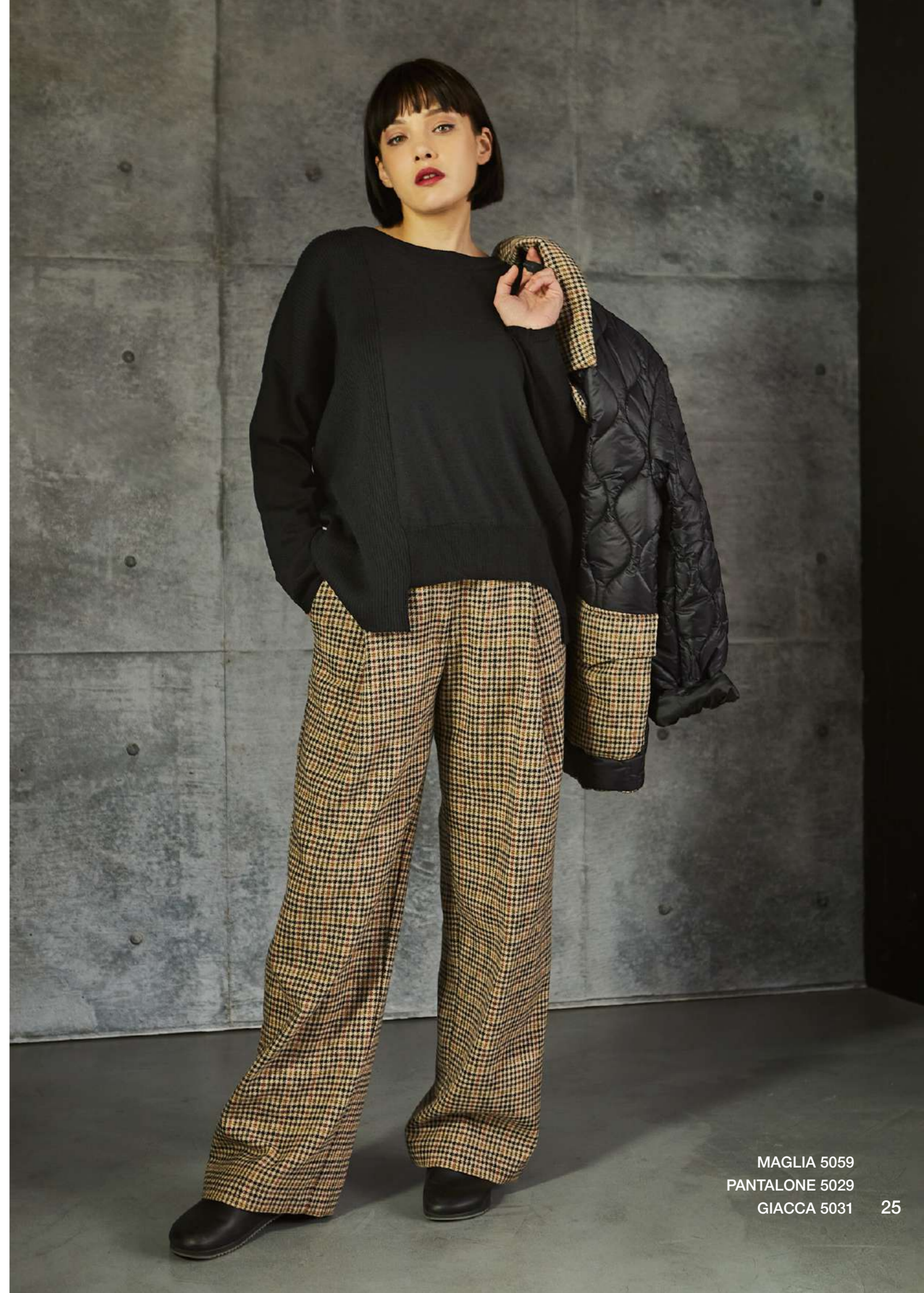
MAGLIA 5059 PANTALONE 5029 GIACCA 5031