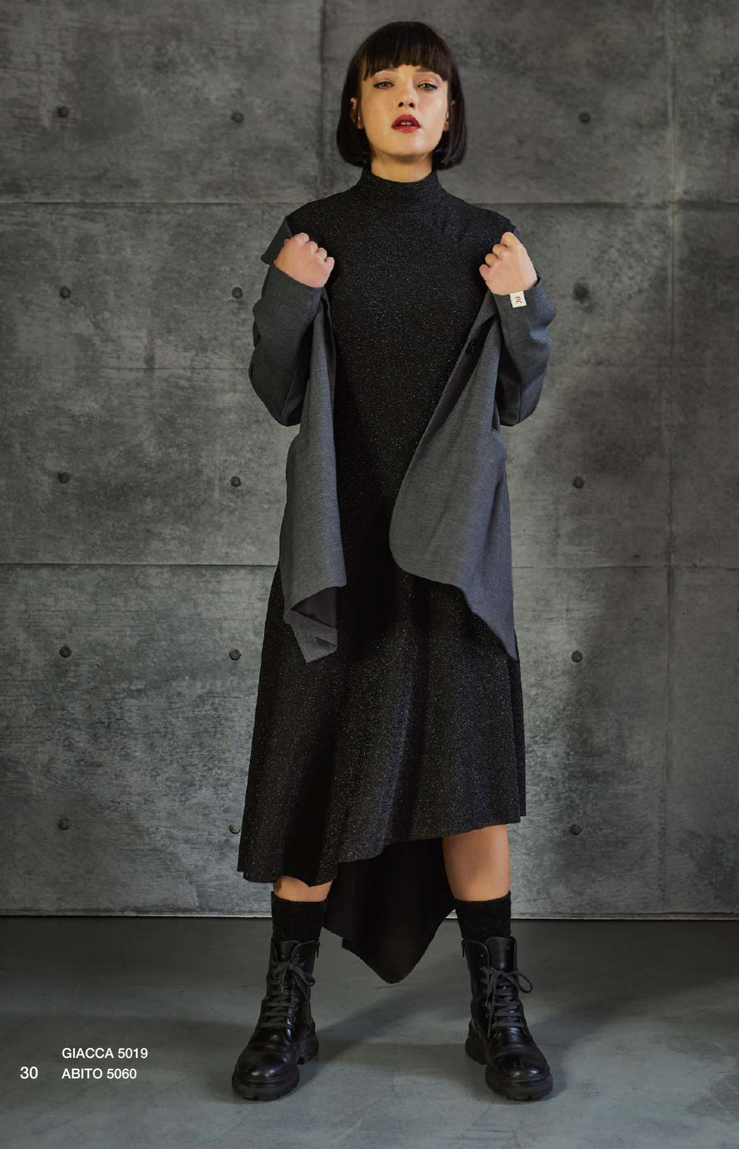
GIACCA 5019 ABITO 5060