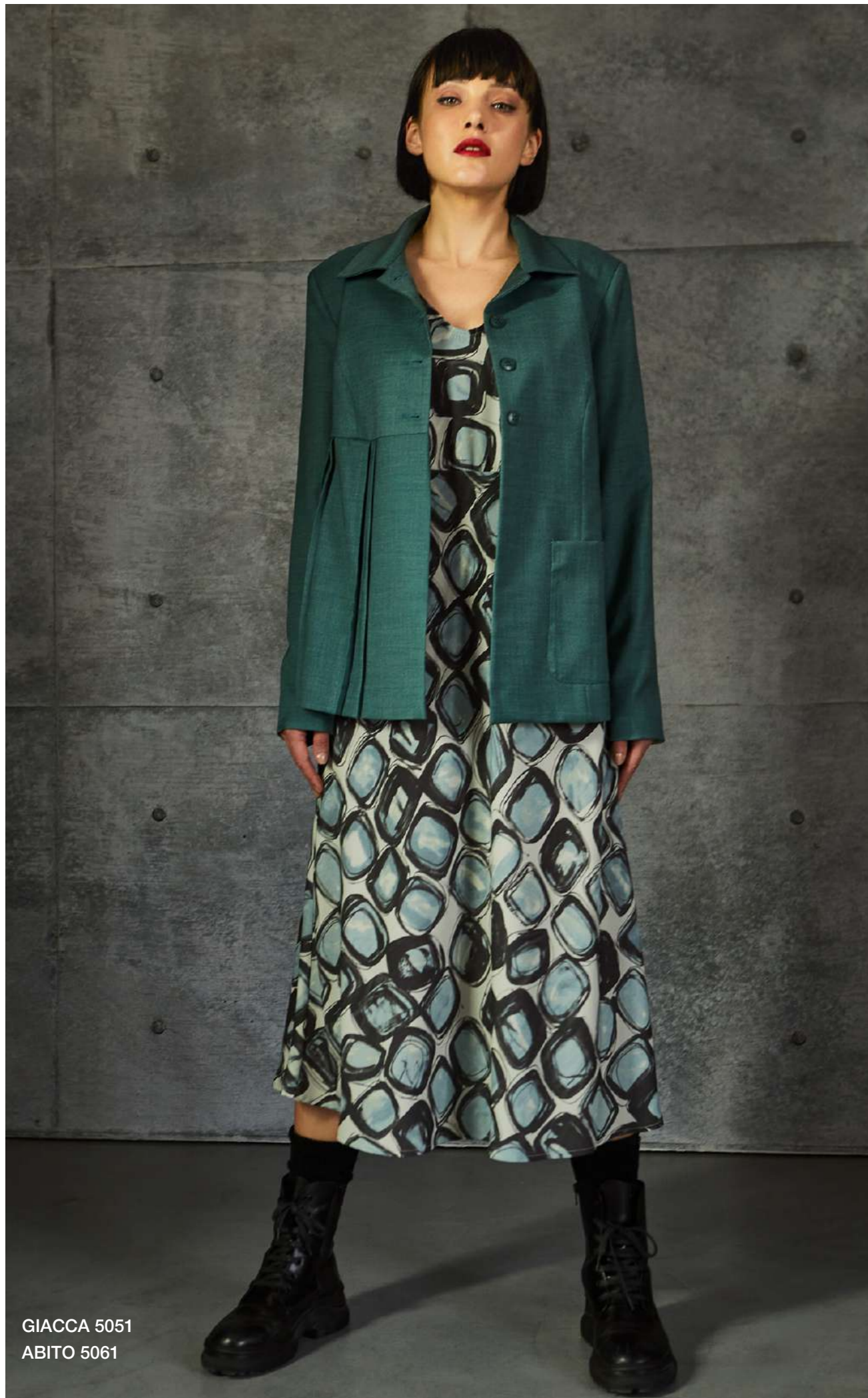
GIACCA 5051 ABITO 5061