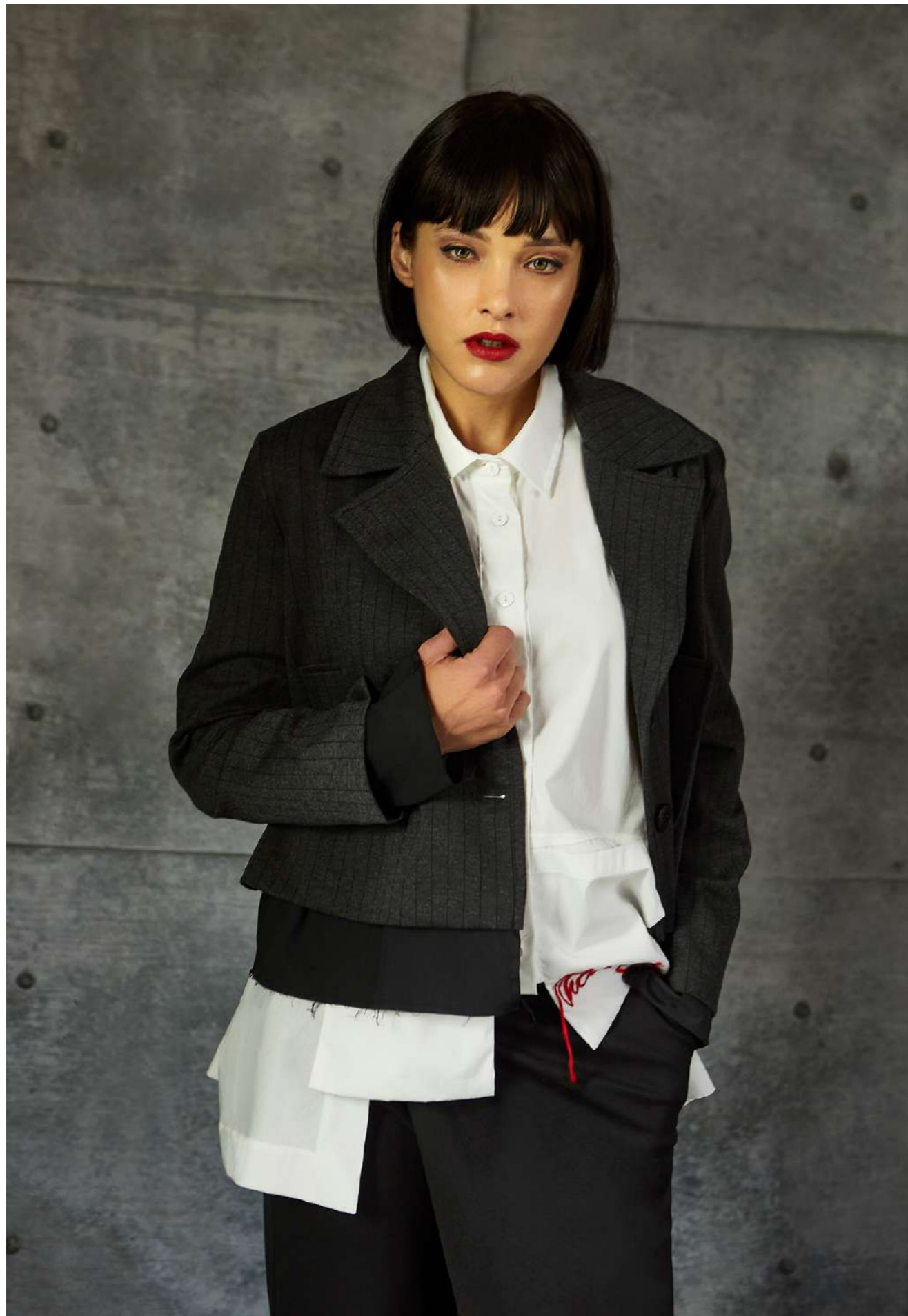
GIACCA 5048 CAMICIA 5038 PANTALONE 5027