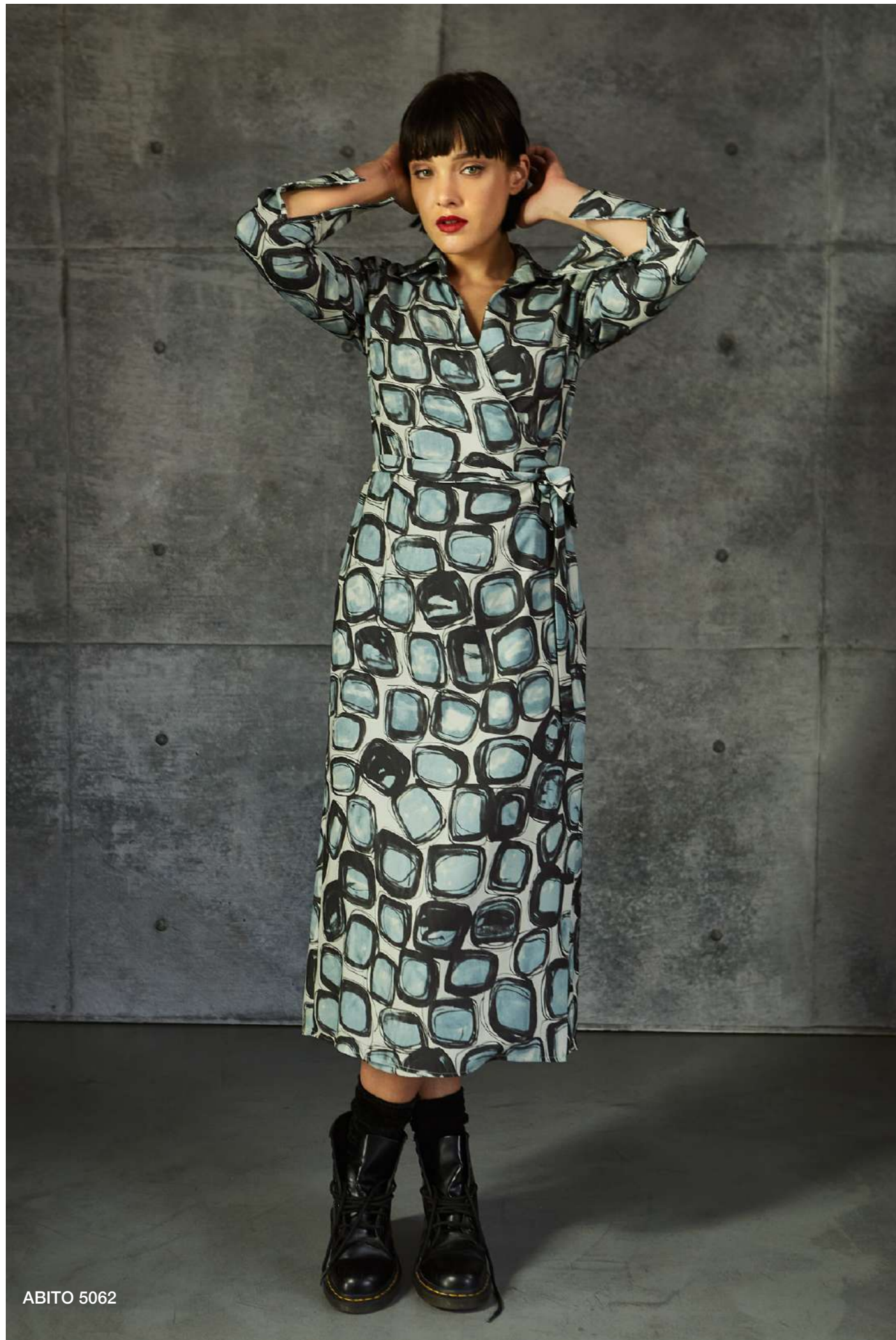
48 ABITO 5062