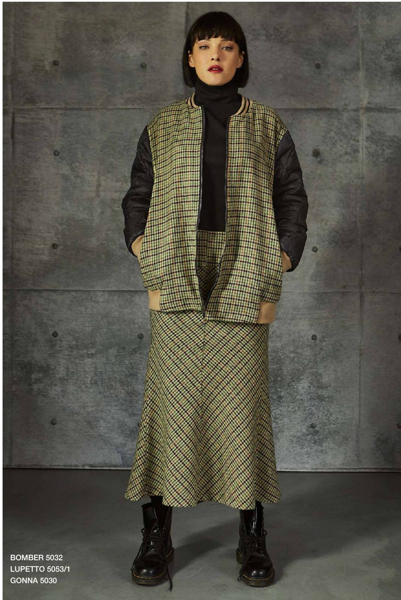
BOMBER 5032 LUPETTO 5053/1 GONNA 5030