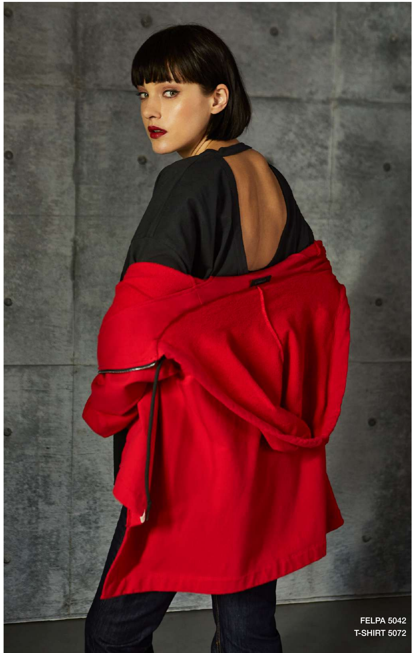
FELPA 5042 T-SHIRT 5072