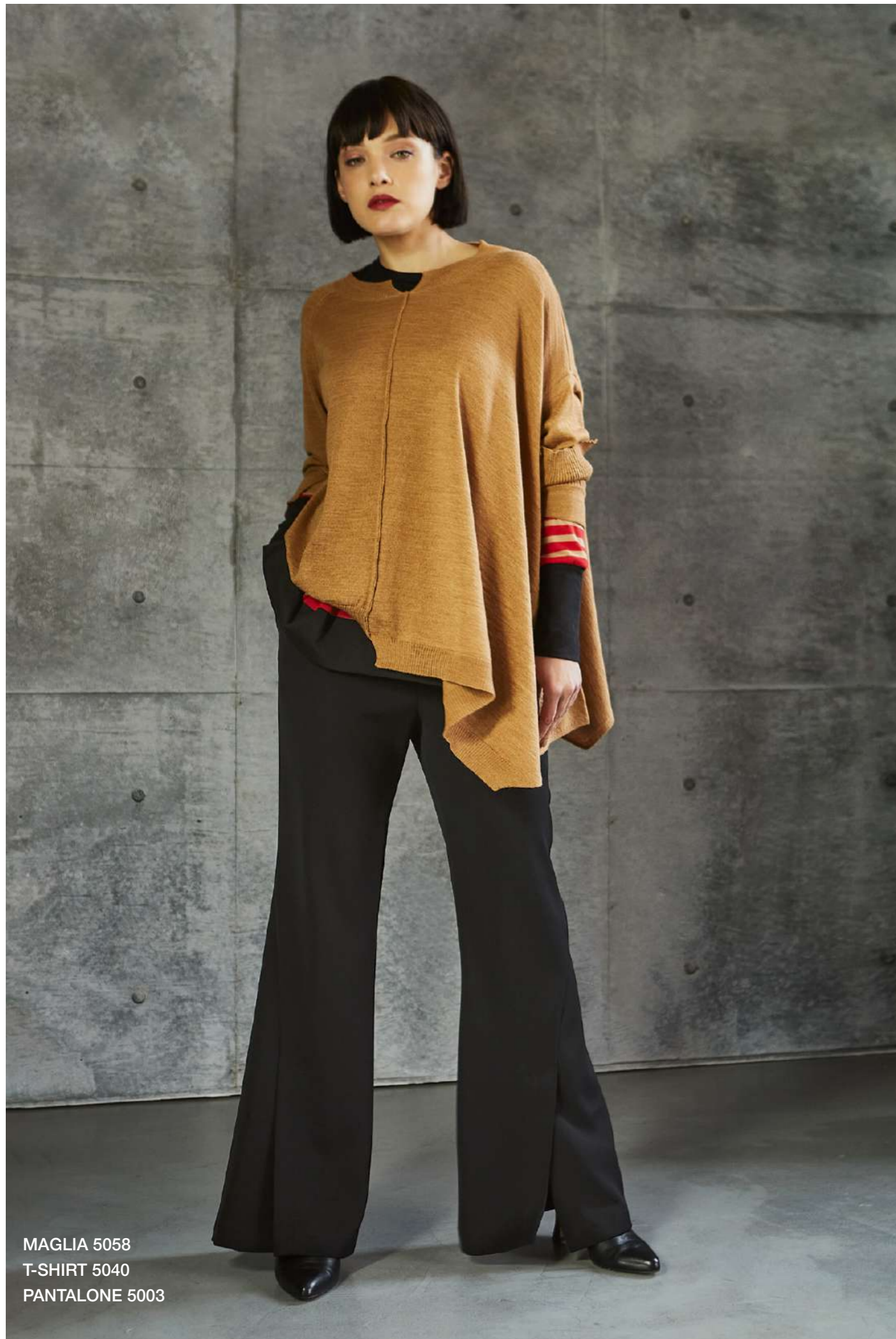
MAGLIA 5058 T-SHIRT 5040 PANTALONE 5003