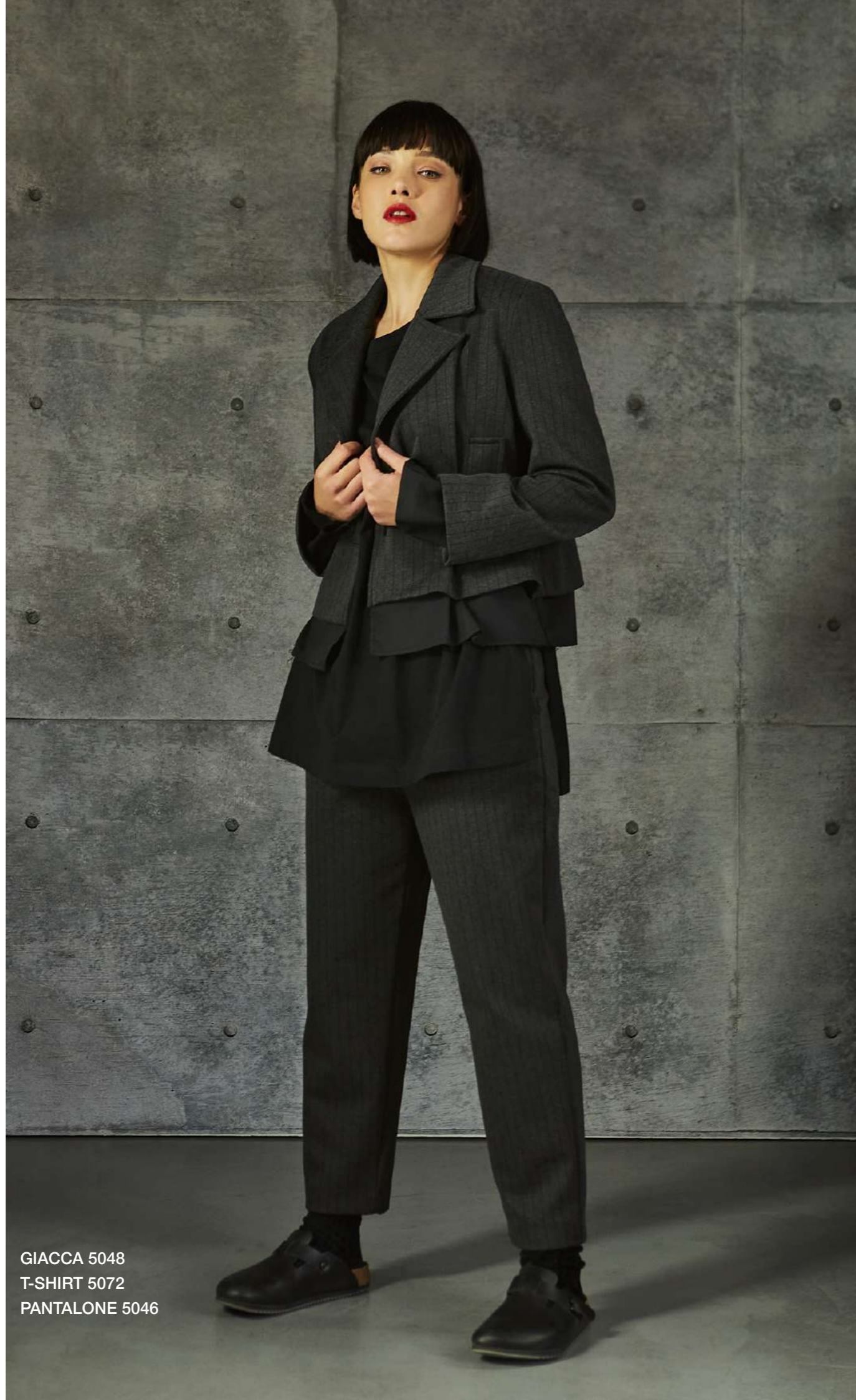
GIACCA 5048 T-SHIRT 5072 PANTALONE 5046