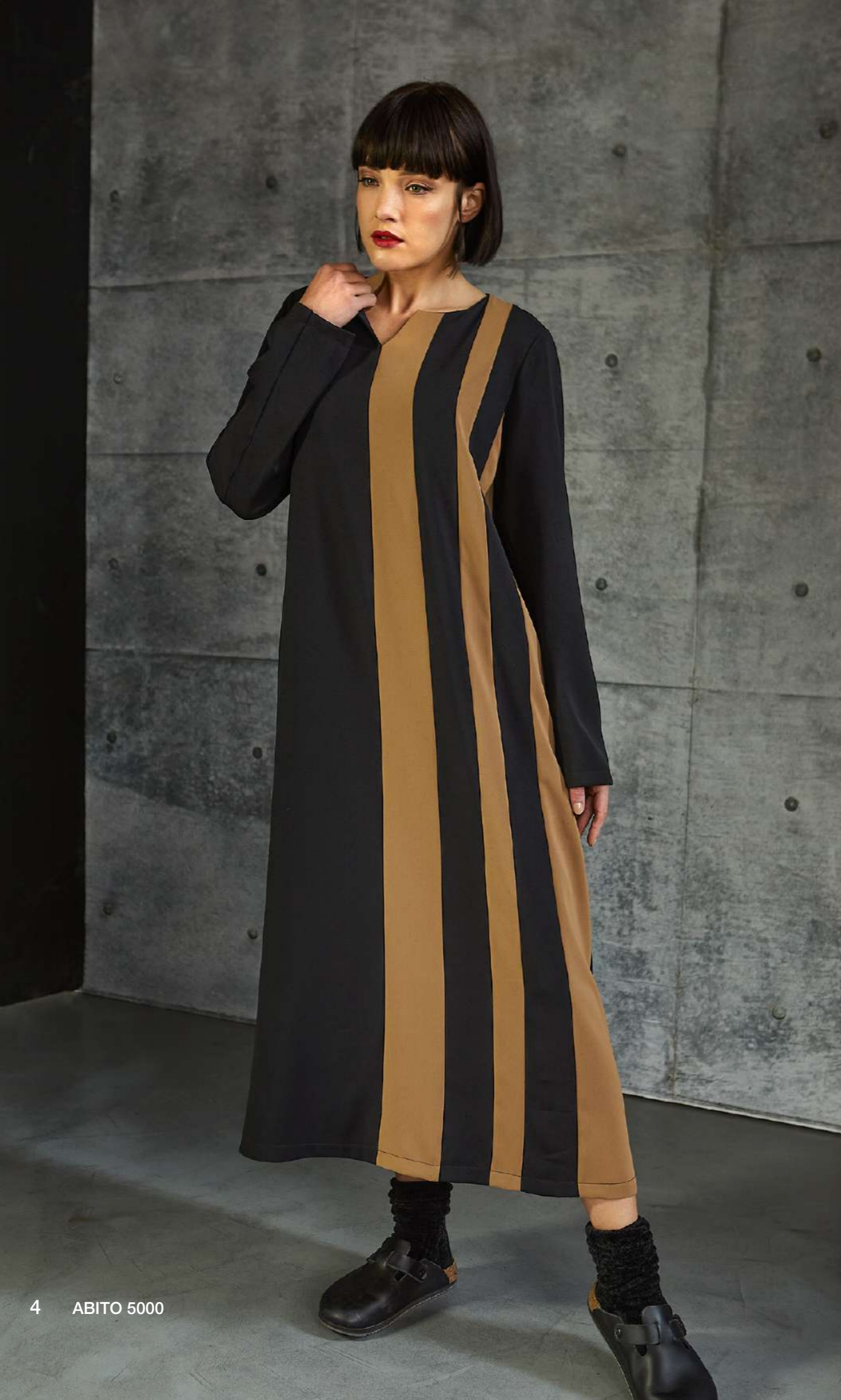
4 ABITO 5000