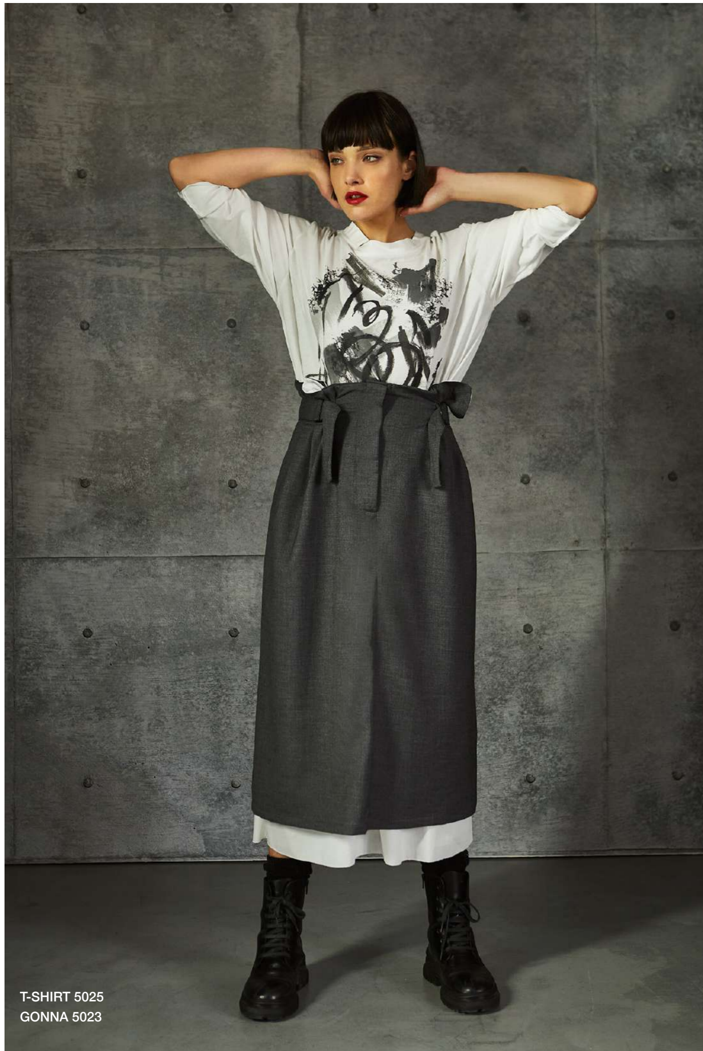
T-SHIRT 5025 GONNA 5023