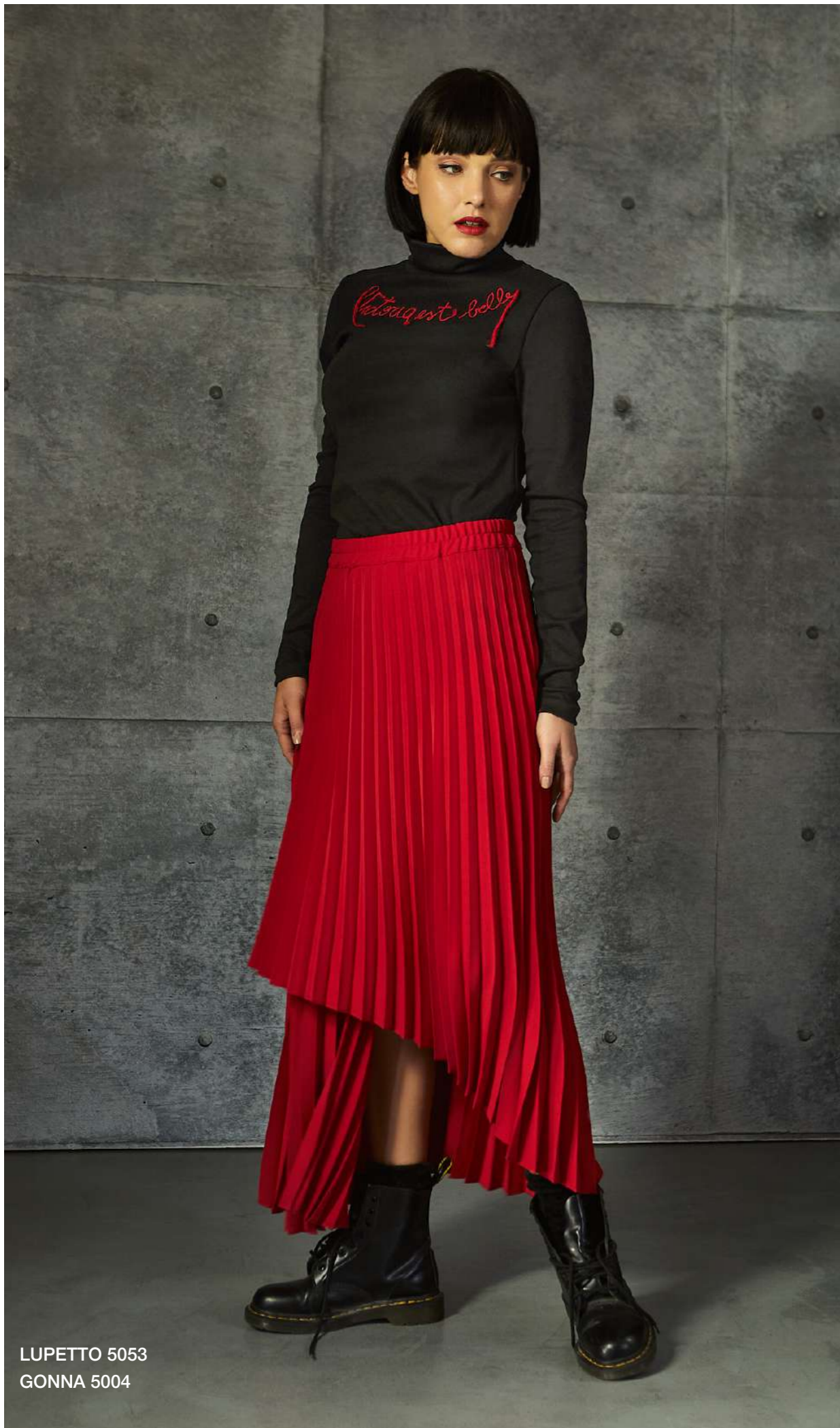
LUPETTO 5053 GONNA 5004