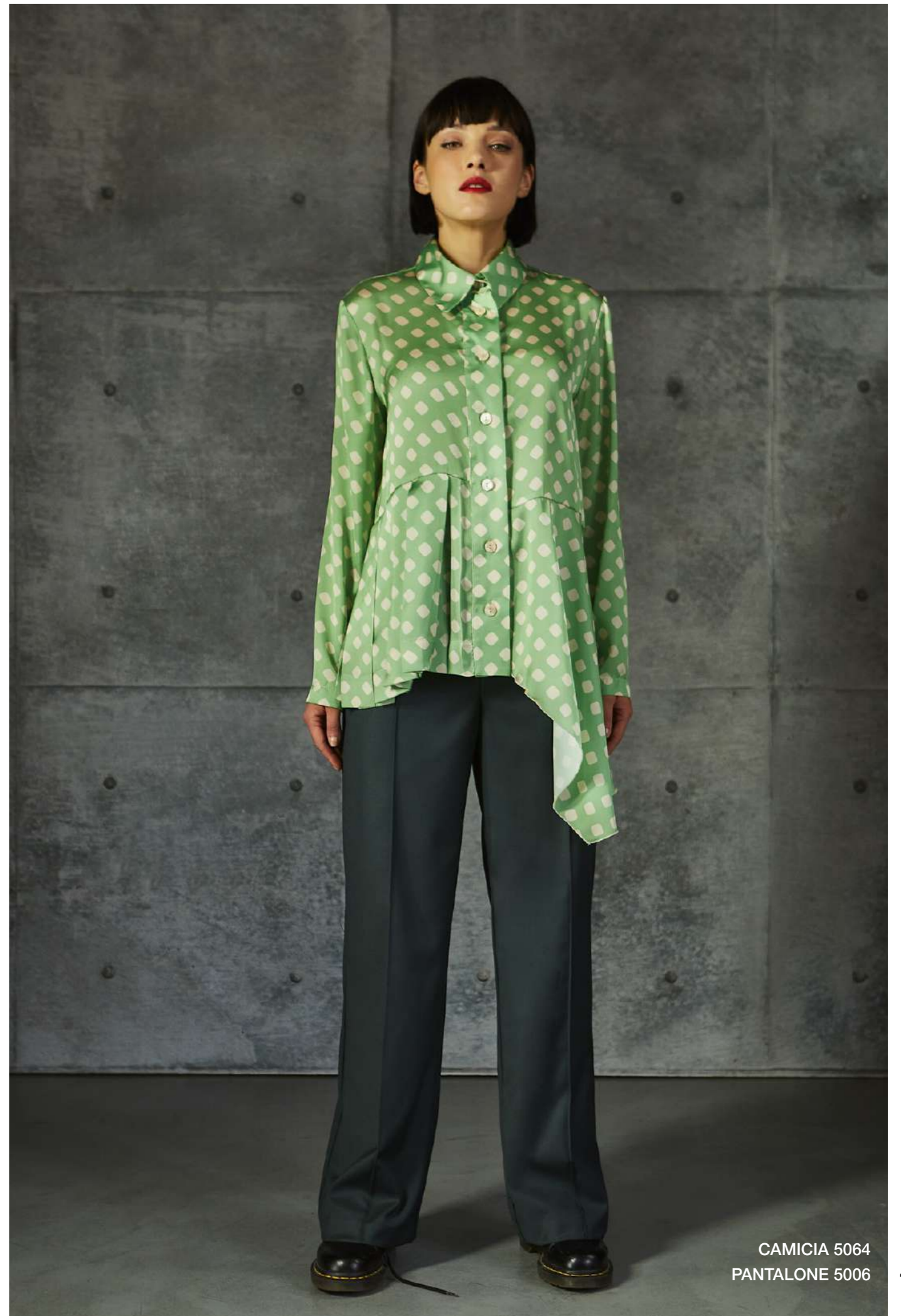
CAMICIA 5064 PANTALONE 5006