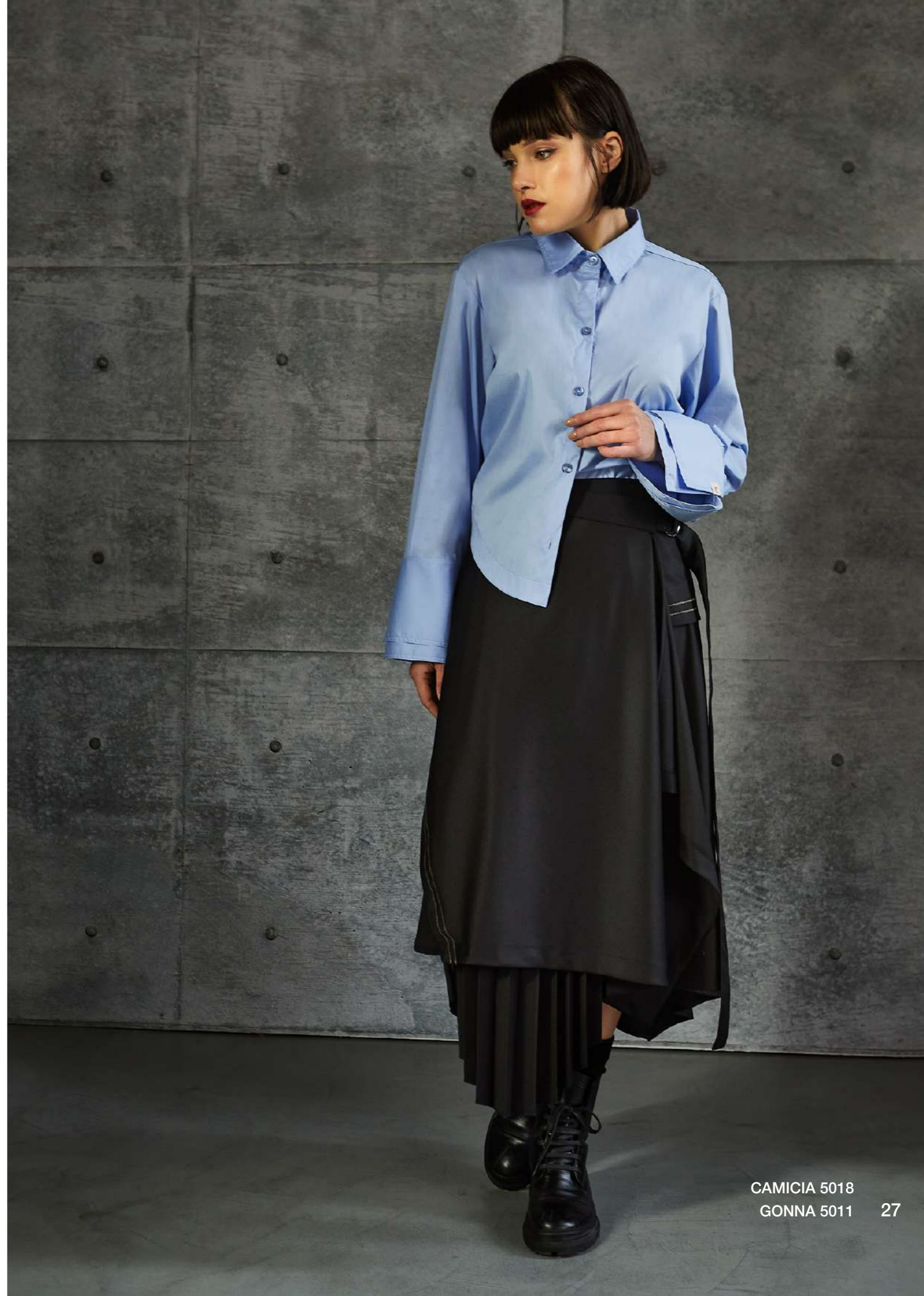
CAMICIA 5018 GONNA 5011