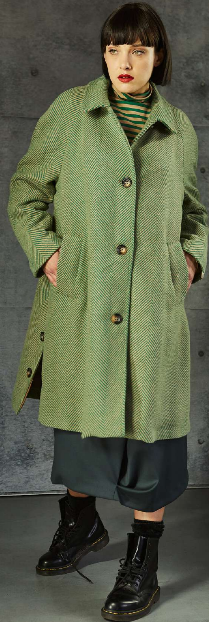
CAPPOTTO 5037 LUPETTO 5068 GONNA 5007