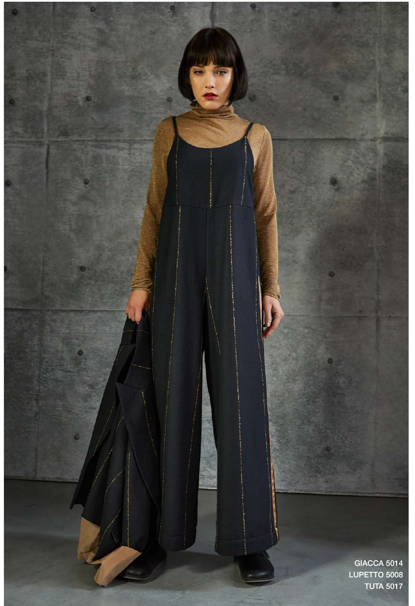
GIACCA 5014 LUPETTO 5008 TUTA 5017