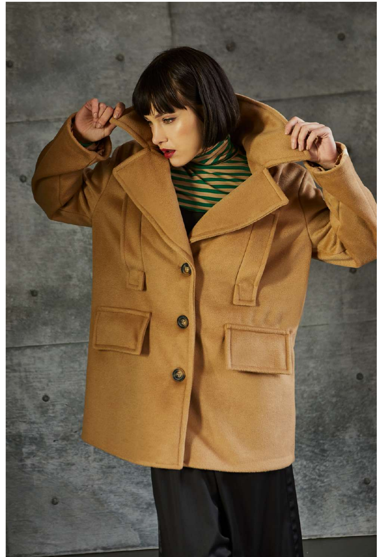
CAPPOTTO 5035 LUPETTO 5068