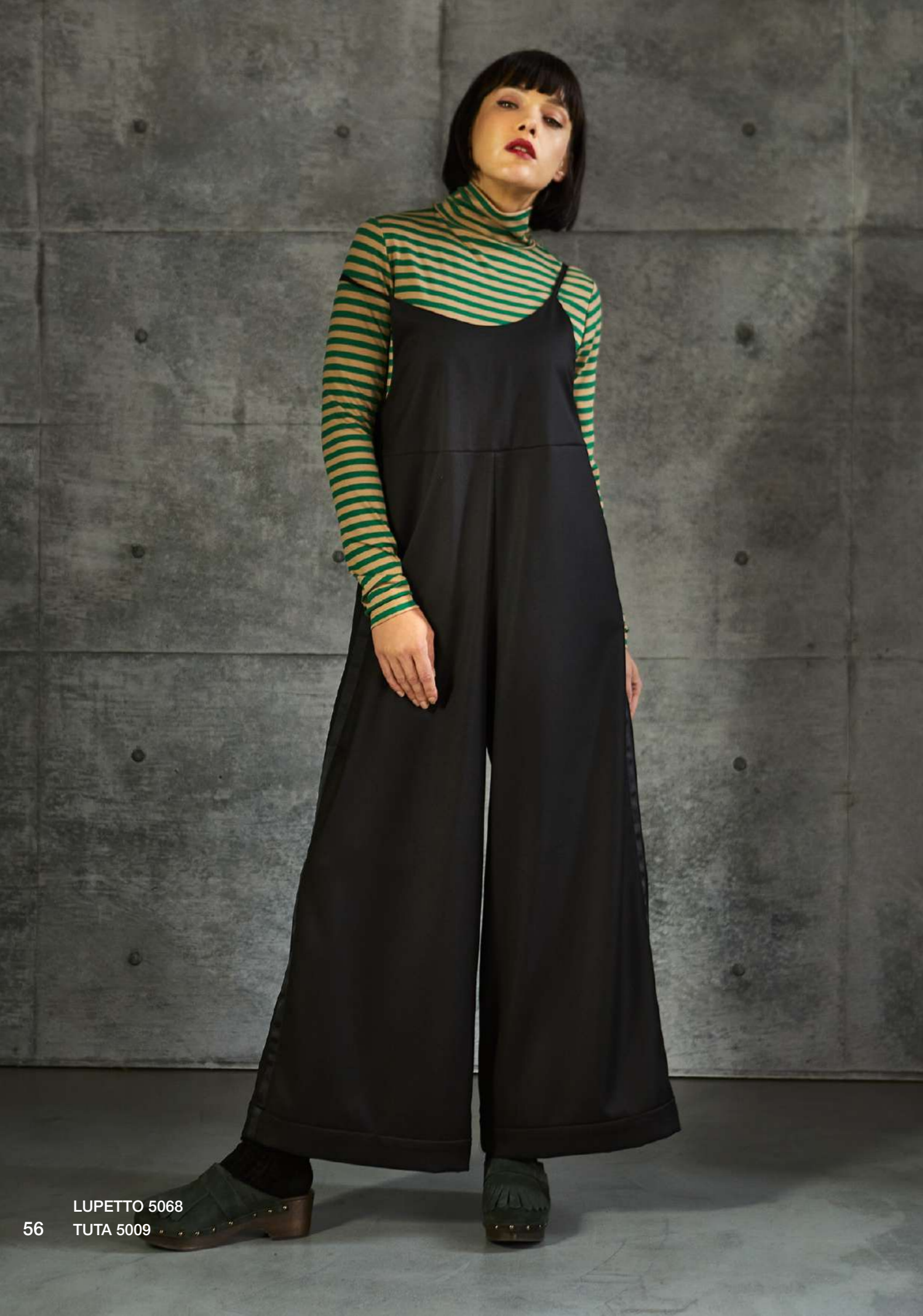
LUPETTO 5068 TUTA 5009