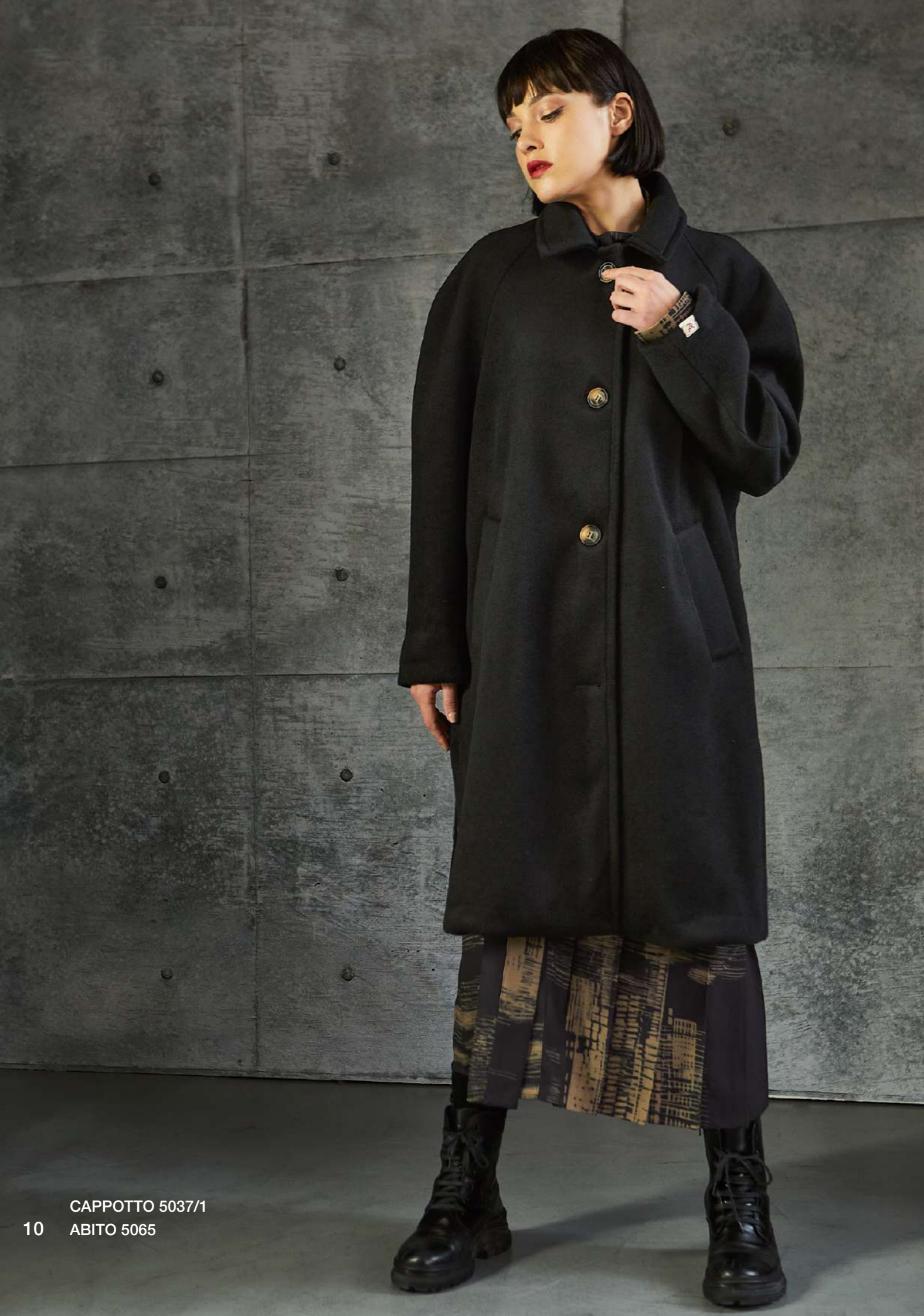
CAPPOTTO 5037/1 ABITO 5065