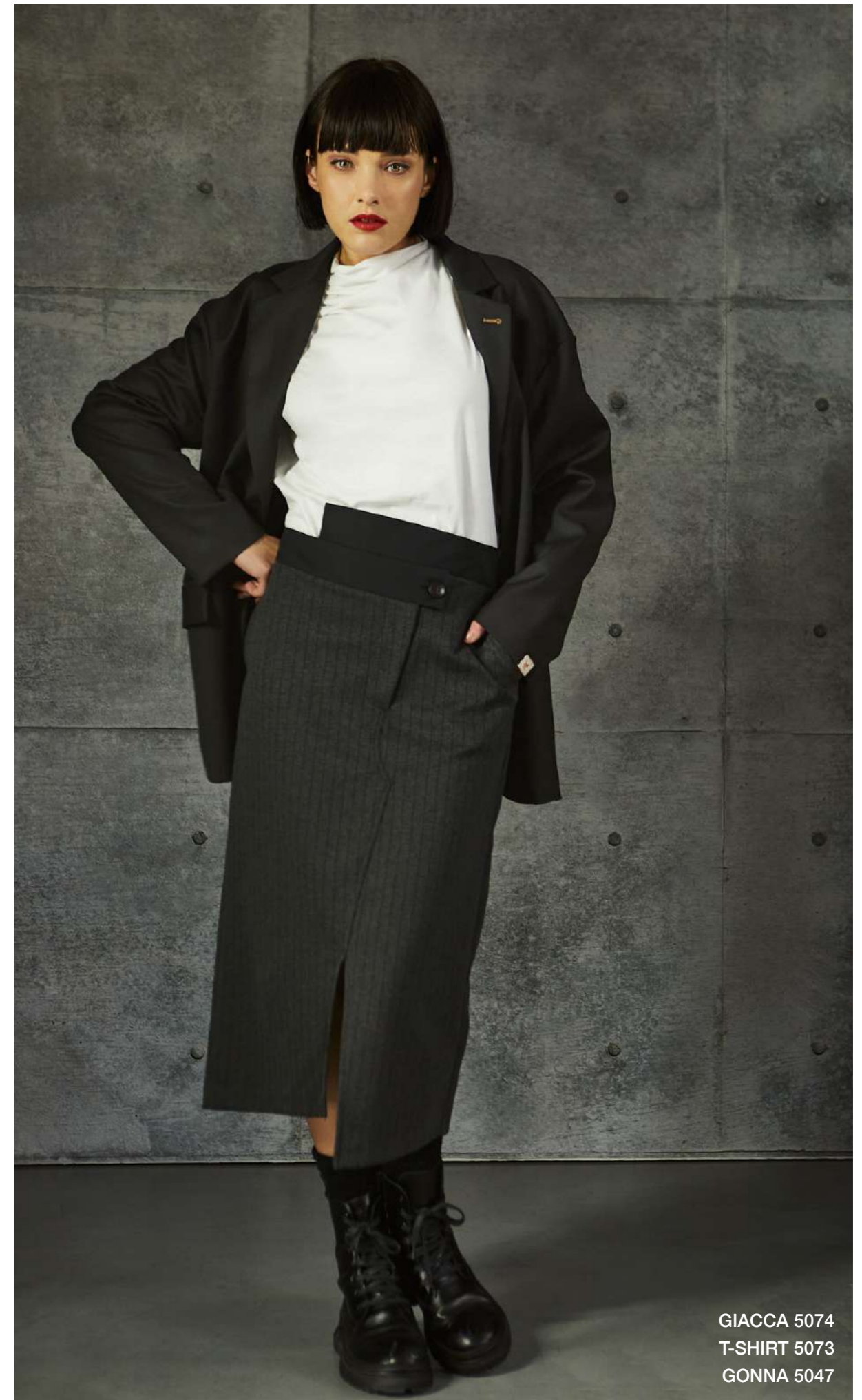
GIACCA 5074 T-SHIRT 5073 GONNA 5047