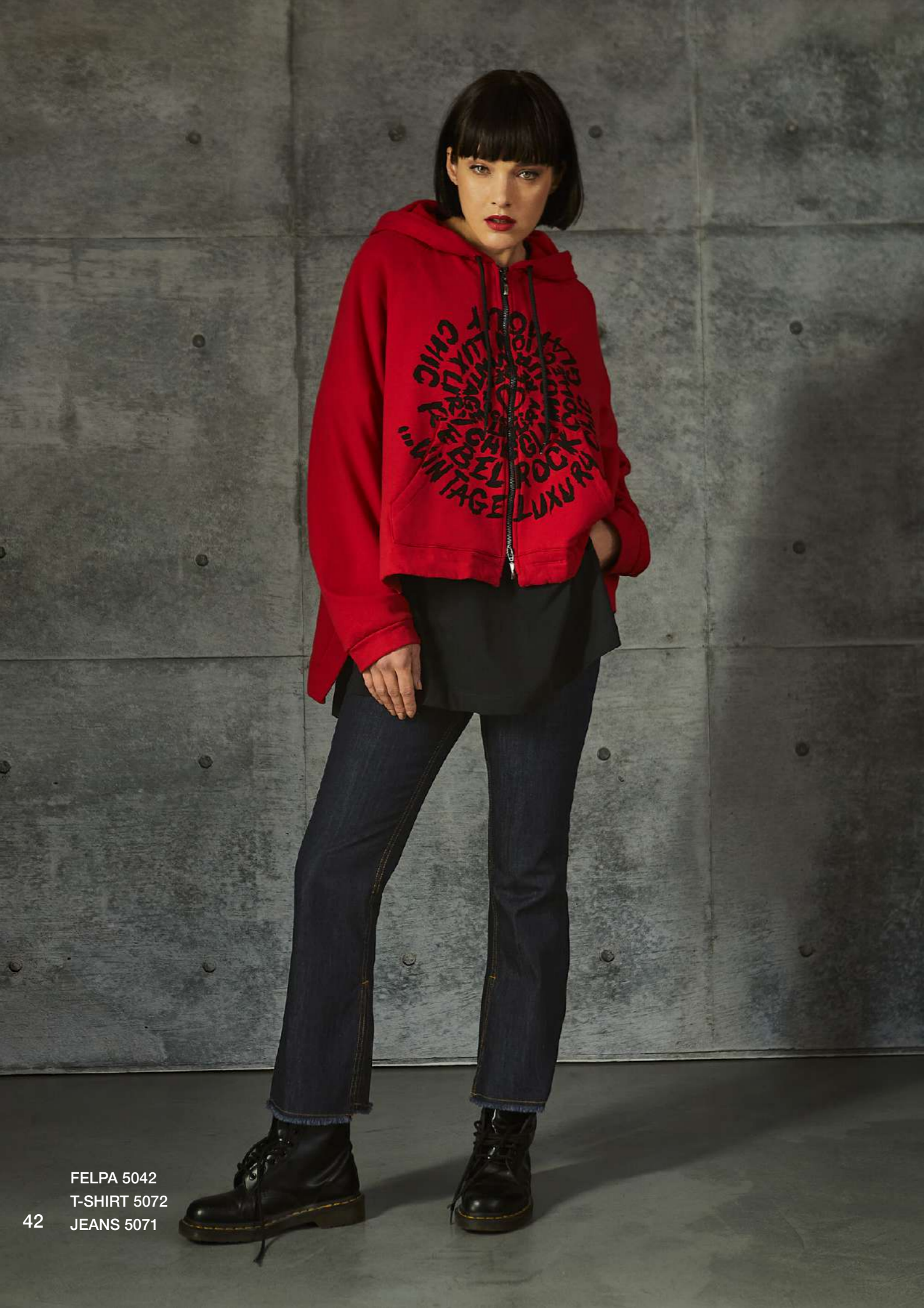
FELPA 5042 T-SHIRT 5072 JEANS 5071